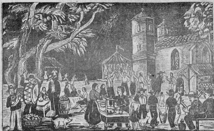
La fiesta del Santo Patrono con gran derroche de música y alegría